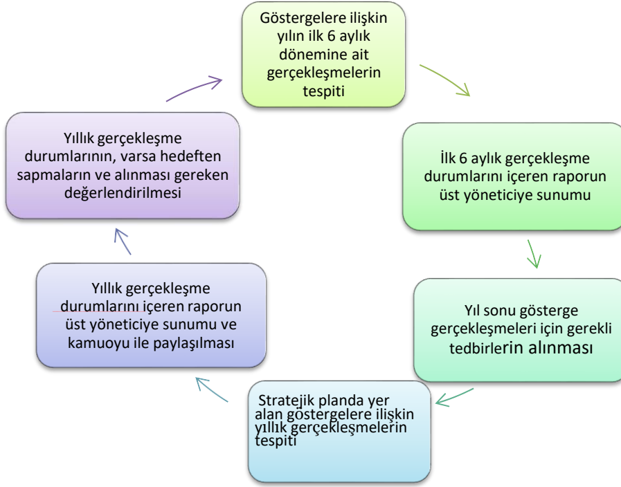
Tablo 39: Stratejik Plan İzleme Değerlendirme Süreci